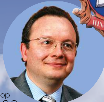
Профессор Янушевич О.О. Ректор МГМСУ, Академик РАН, Заслуженный врач РФ, Главный специалист по стоматологии МЗ РФ Президент Общероссийской общественной организации «Общество врачей России»